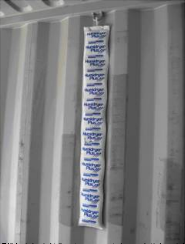
Gi i nhn bít m trong container và thùng hàng