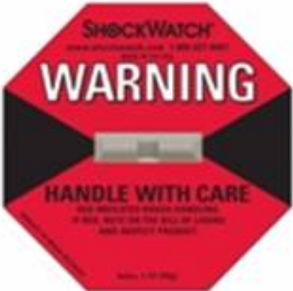
Sản phẩm này được thiết kế để bảo vệ các sản phẩm khỏi bị hư hỏng do va đập và rung động trong quá trình vận chuyển.